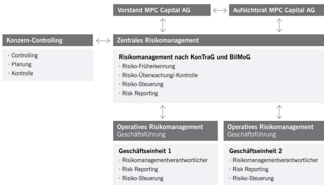
MPC Capital Risikomanagementsystem (vereinfacht)

Das Risikomanagementsystem ist jeweils Bestandteil der Jahresabschlussprüfung und erfüllt die Voraussetzungen des Gesetzes zur Kontrolle und Transparenz im Unternehmensbereich (KonTraG).